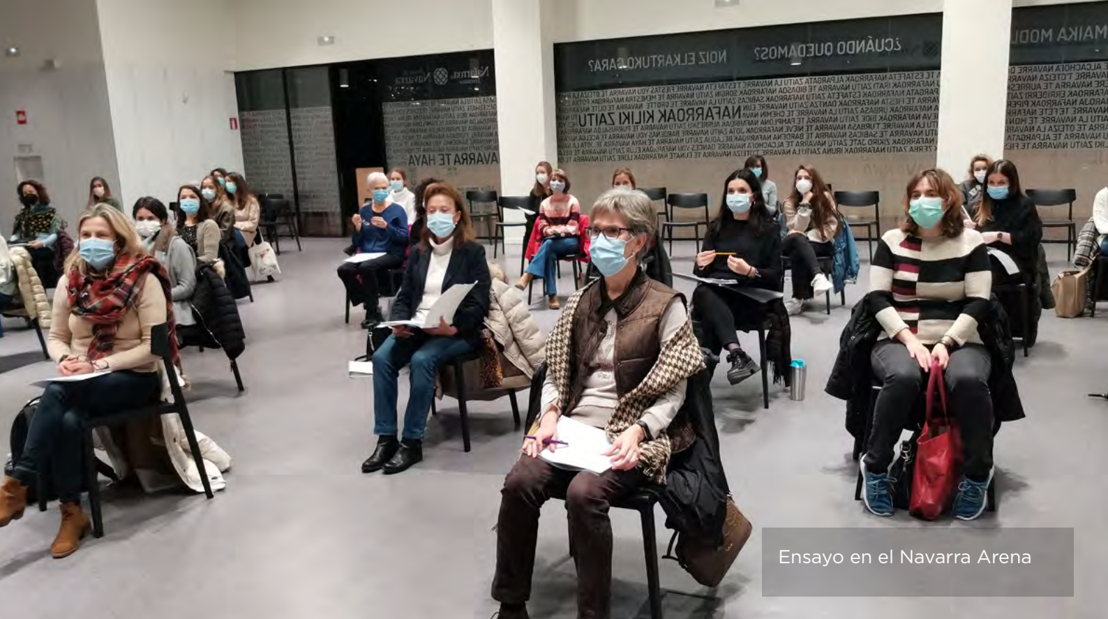
Ensayo en el Navarra Arena