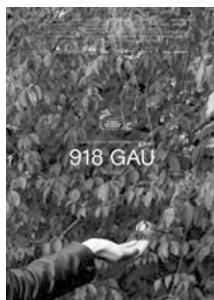
Cartel de la película.

De aquellos días conserva algunos recuerdos: las interminables vueltas por el patio, los campeonatos de natación, el periplo carcelario de una compañera... Tras pasar 918 noches encerrada,