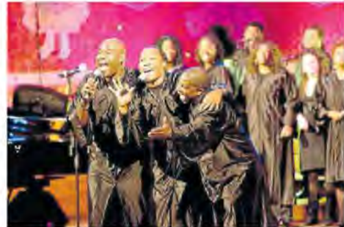
Alabama Gospel Choir actúa hoy en Baluarte.

Tomarán el testigo las propuestas para el público infantil y familiar. El domingo 26 de diciembre llegará La Granja de Zenón con su espectáculo ¡Exacto!. También los días 29 y 30 de diciembre estará la ópera familiar All Babá y los 40 ladrones que pondrá en escena Ópera de Cámara de Navarra. El nuevo año se estrenará con el regreso de la compañía de títeres y marionetas Maese Villarjo, los días 3 y 4 de enero, que presentará dos títulos: Gor-