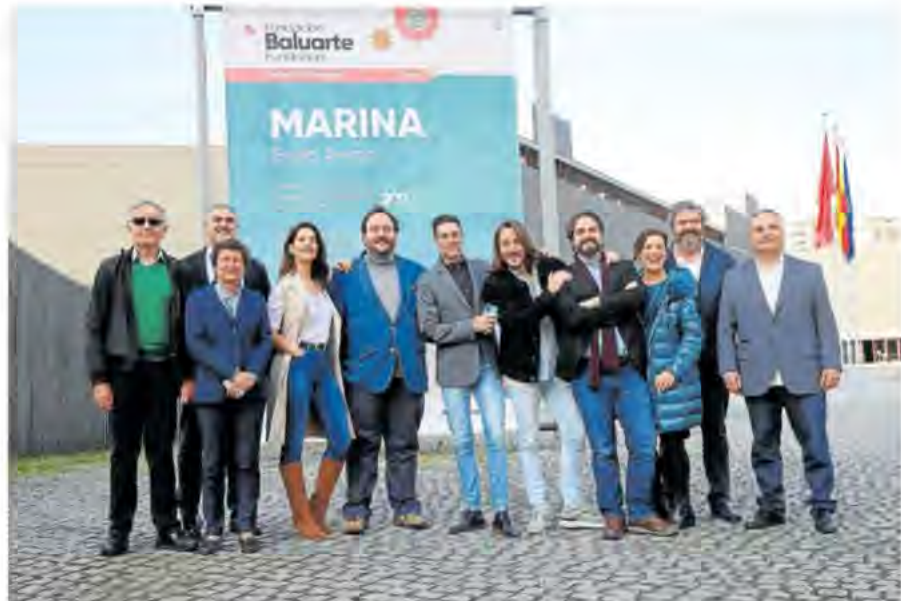
Foto de familia de parte de los responsables artísticos de la ópera 'Marina'.

En ese sentido, el ponente se refiere al mito de Orfeo como un viaje al centro del dolor y al submundo de las sombras, como una biografía representativa de los que padecen. Y donde al igual que en la mitología a Orfeo la melodía de su lira le ampara en la búsqueda de Eurídice, plantea el valor de la música como la calma de los que nunca se han sentido a salvo en la civilización. - Eje/Diario de Noticias