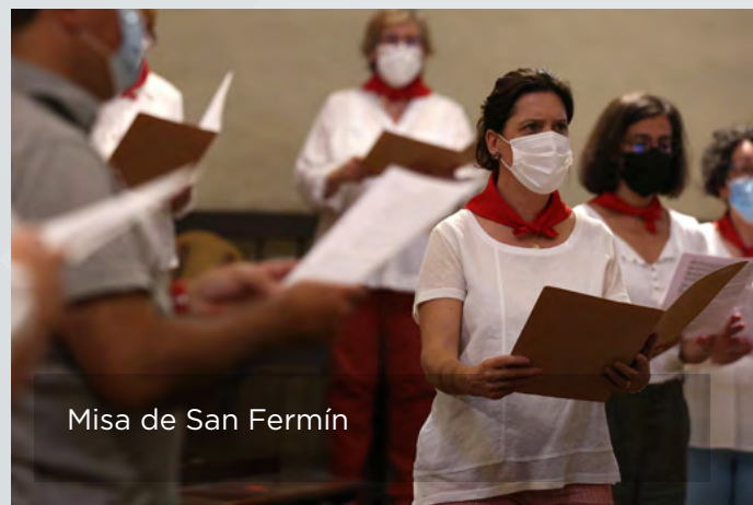
Misa de San Fermín