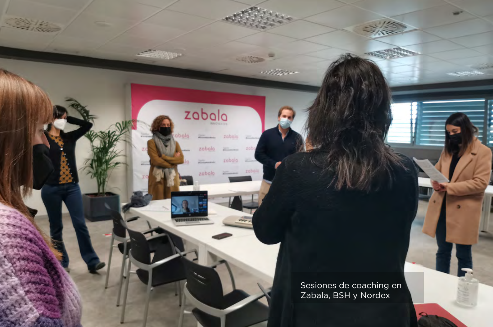
Sesiones de coaching en Zabala, BSH y Nordex