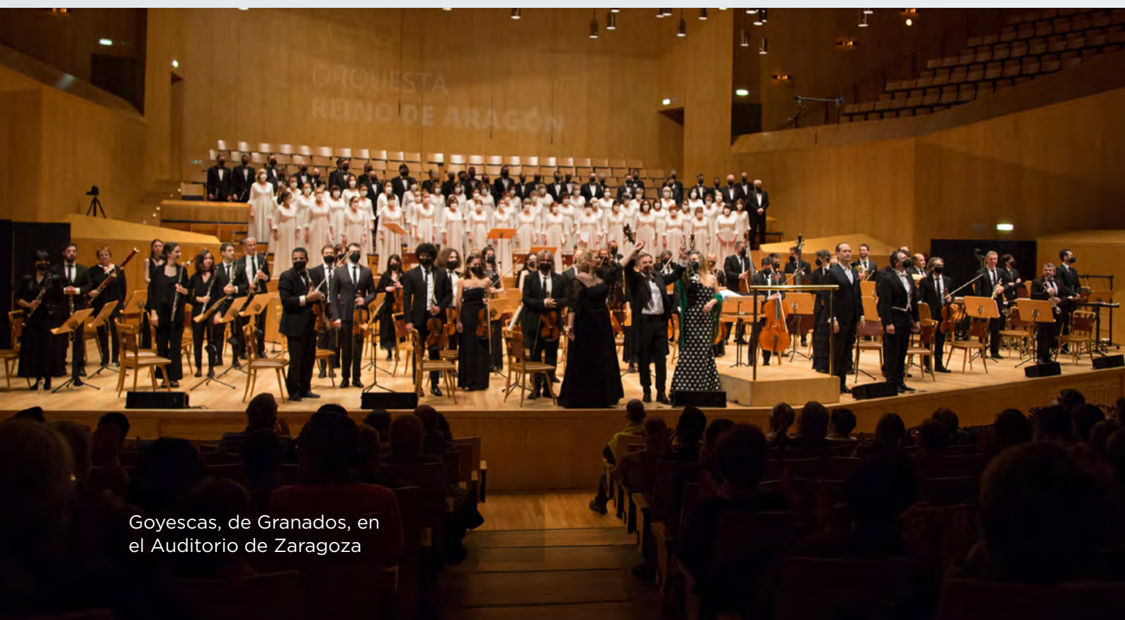
Goyescas, de Granados, en el Auditorio de Zaragoza