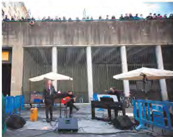
Imagen de una de las actuaciones que se llevaron a cabo con motivo del homenaje a Sabicas.

(16 de marzo de 1912) pero ciudadano del mundo, vivió y viajó por toda España y tras la Guerra Civil, por Argentina, México y Estados Unidos. Allá donde vivió, nunca olvidó sus orígenes. El presunido de ser navarro y gitano, de ser gitano y navarro. De hecho, y a pesar de fallecer en la ciudad de Nueva York, su deseo antes de morir fue el de ser enterrado en tierras navarras. Desde el año 1990 yace en el cementerio municipal de Pamplona. - Diario de Noticias