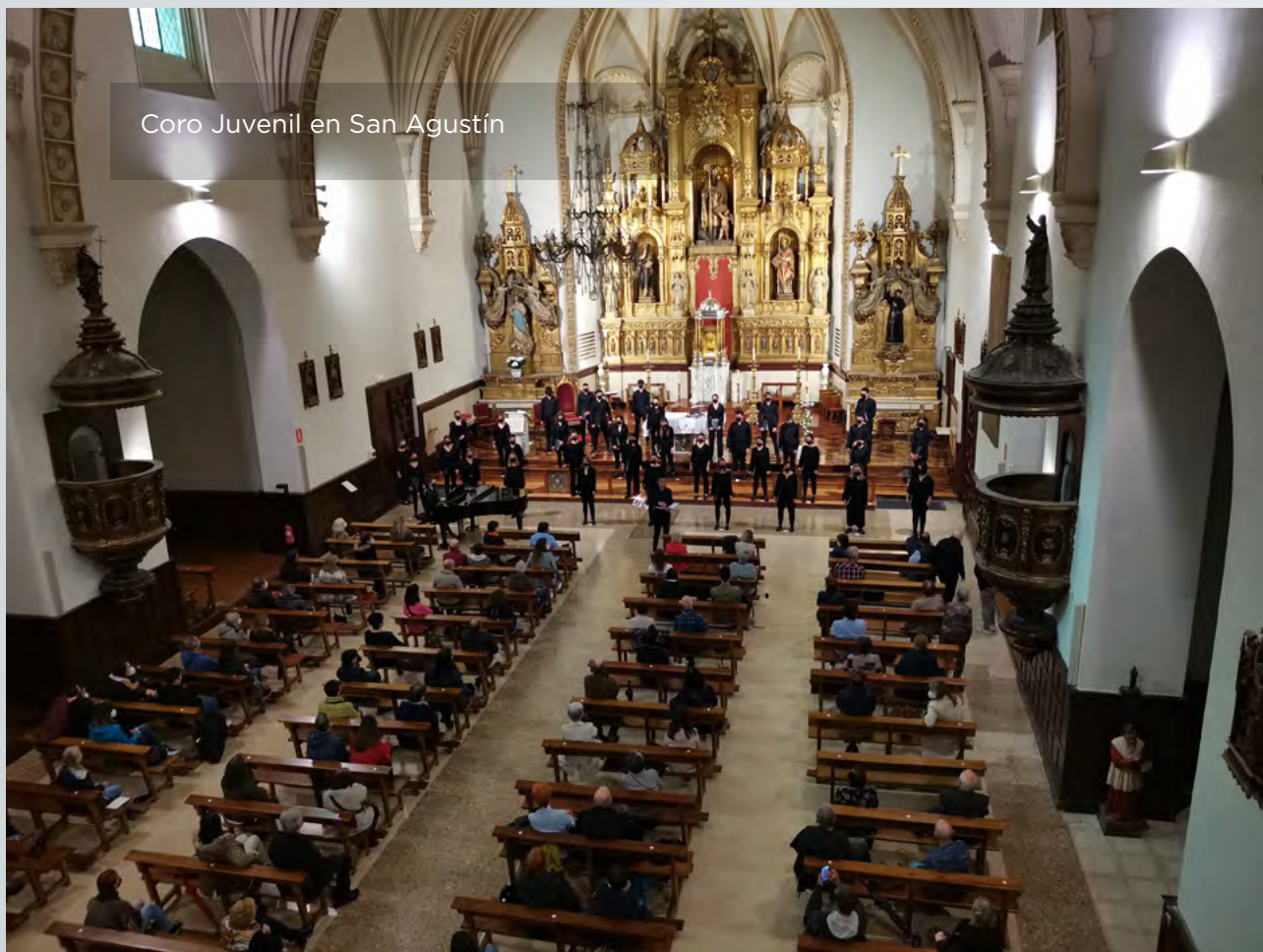
Coro Juvenil en San Agustín