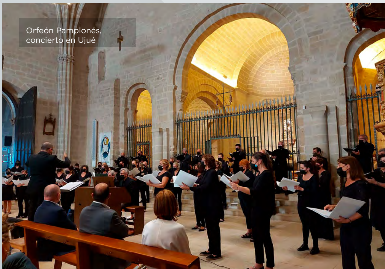
Orfeón Pamplonés, concierto en Ujué