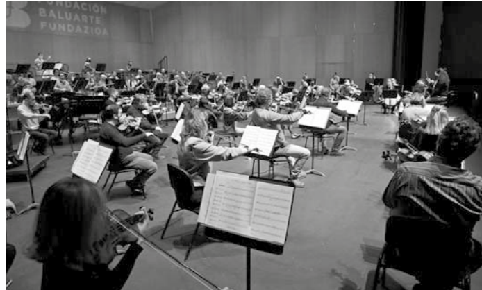
Músicos de la Orquesta Sinfónica de Navarra, durante un ensayo en Baluarte.

Por su parte, el Teatro Gaztambide de Tudela también acogerá otros cinco conciertos que tendrán lugar el 5 de noviembre, el 14 de enero, el 18 de febrero, el 8 de abril y el 29 de abril. También se unificarán los horarios de todos los conciertos, que tendrán lugar a las 19:30 horas en Pamplona, Tudela y Tafalla.