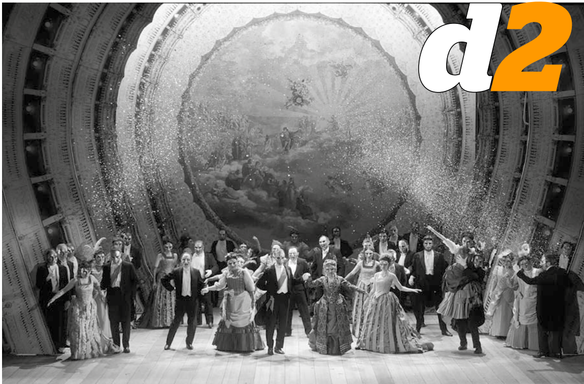
Una escena de Un ballo in maschera de Verdi, único título operístico que se representará de manera escenificada.