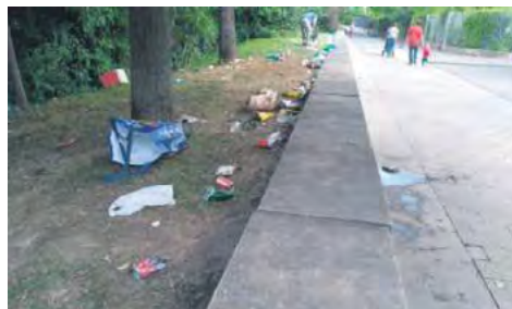
Restos de un botellón en el puente de El Vergel.

En un comunicado, ANAPEH explicó que temía que “la relajación de la sociedad pudiera conducir a una nueva ola de casos y desgraciadamente, así está siendo, y lo está siendo en un momento clave para el turismo y la hostelería, cuando parecía que por fin íbamos a poder levantar cabeza”.