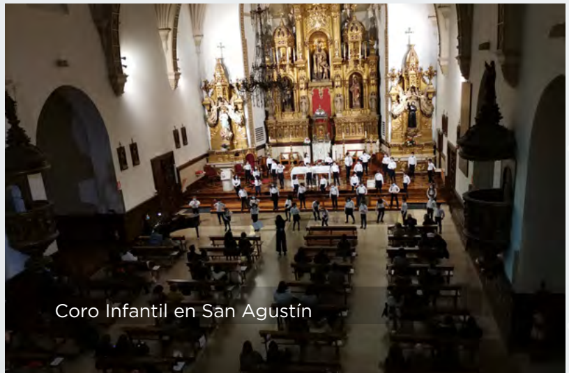
Coro Infantil en San Agustín