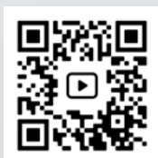
Ensayo Coro Infantil

Se realizaron grabaciones para el vídeo solidario con las residencias Solera Urban con la participación del Coro Infantil y la gala para la Fundación Juan Bonal, con la participación de la Escolanía y el Coro Juvenil.