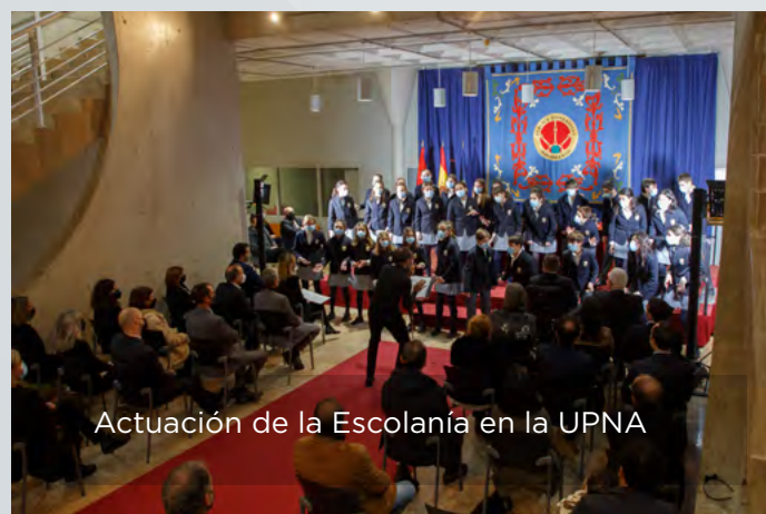
Actuación de la Escolanía en la UPNA