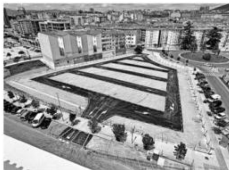
Vista de la bolsa de aparcamiento que cambiará de modelo en el barrio.

El primer aparcamiento de la calle El Mochuelo se localiza entre las calles Río Ultzama, Río Irati, Mochuelo y avenida de Zaragoza, ocupa una superficie de 3.564 m 2 y tiene 158 plazas. El segundo