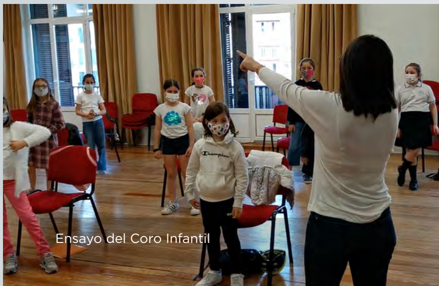
Ensayo del Coro Infantil