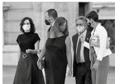
María Chivite (dcha), ayer, con otros presidentes autonómicos.