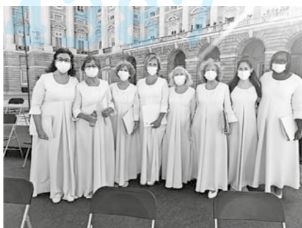
Algunas de las orfeonistas, ayer en Madrid.