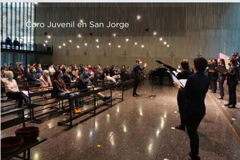
Coro Juvenil en San Jorge