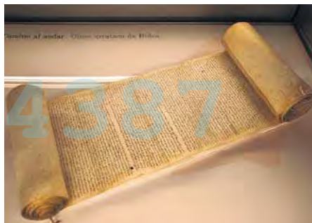
Uno de los documentos de la muestra.

Se hace Camino al andar reflexiona sobre el protagonismo de las personas peregrinas en la construcción de sus itinerarios particulares, lo que dio lugar a una red de caminos cuyo objetivo común era alcanzar la tumba del apóstol, De puente a puente... destaca la importancia de las infraestructuras para el desarrollo económico y comercial del Occidente europeo desde época medieval —uno de los ejemplos más notables es el de Puente la Reina, —; Poblar, fabricar, mercader recuerda "la vinculación entre el despertar urbano del norte peninsular y el impulso de las peregrinaciones compostelanas, una de cuyas consecuencias fue la fundación de nuevos burgos y