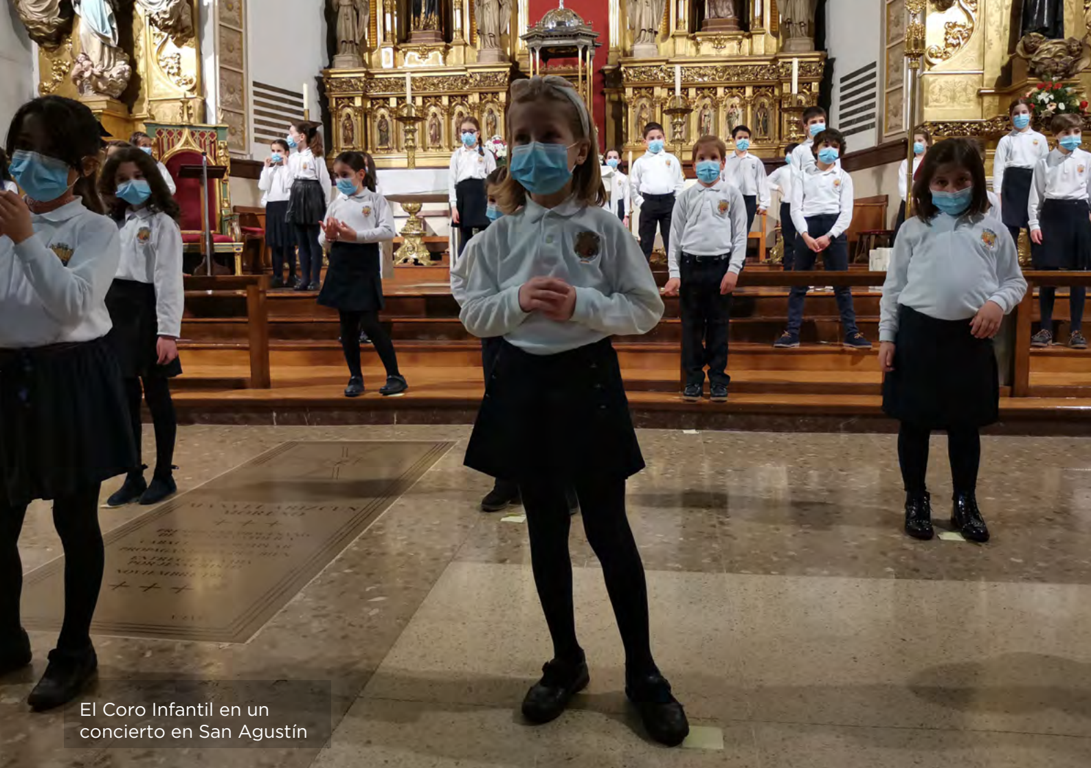
El Coro Infantil en un concierto en San Agustín