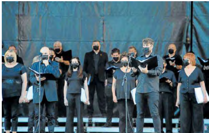
Una actuación del Orfeón Pamplonés durante el año pasado.

Asimismo, la nueva temporada incluye otros formatos como las actuaciones en residencias. Concretamente, dentro de un acuerdo de colaboración con Laboral Kutxa, se inicia un ciclo de actuaciones prenavideñas y navideñas en residencias de Pamplona y otros pun-