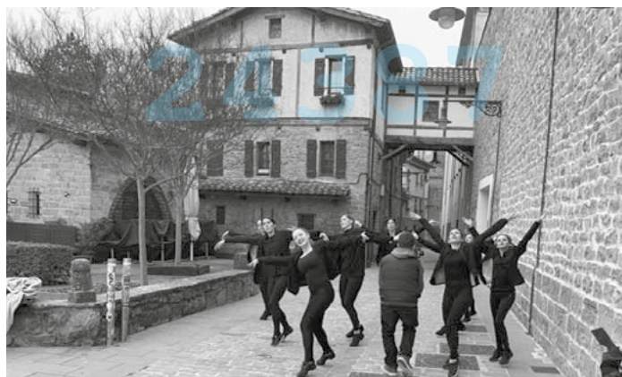
Otro grupo de Le Bal, bailando en El Caballo Blanco de Pamplona.