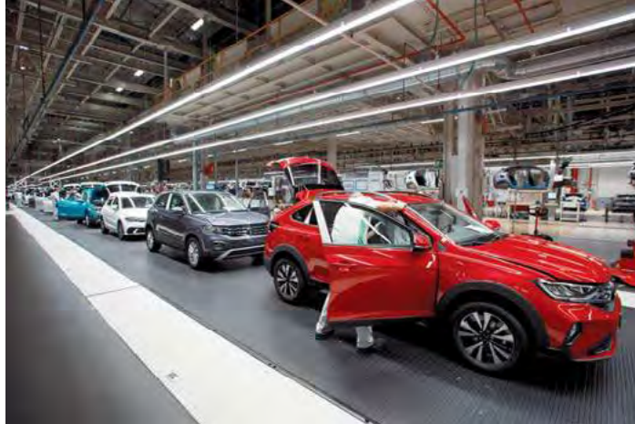
Los tres modelos de Landaben, en línea: Taigo (rojo), T-Cross (gris) y Polo (blanco).

Por el momento, no hay una estimación del recorte de producción que va a suponer estos días extra de cierre, aunque una simple multiplicación puede dar una idea aproximada del efecto que tendrá. Si en una jornada habitual salen 1.481 coches de la cadena de montaje, el recorte final se situará en torno a algo más de 10.000 coches menos. Además de estos cierres, hoy está previsto que la dirección comunique al comité la previsión de calendario a partir