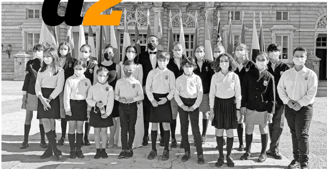
Los niños del Orfeón Pamplonés que participaron en el acto de ayer.