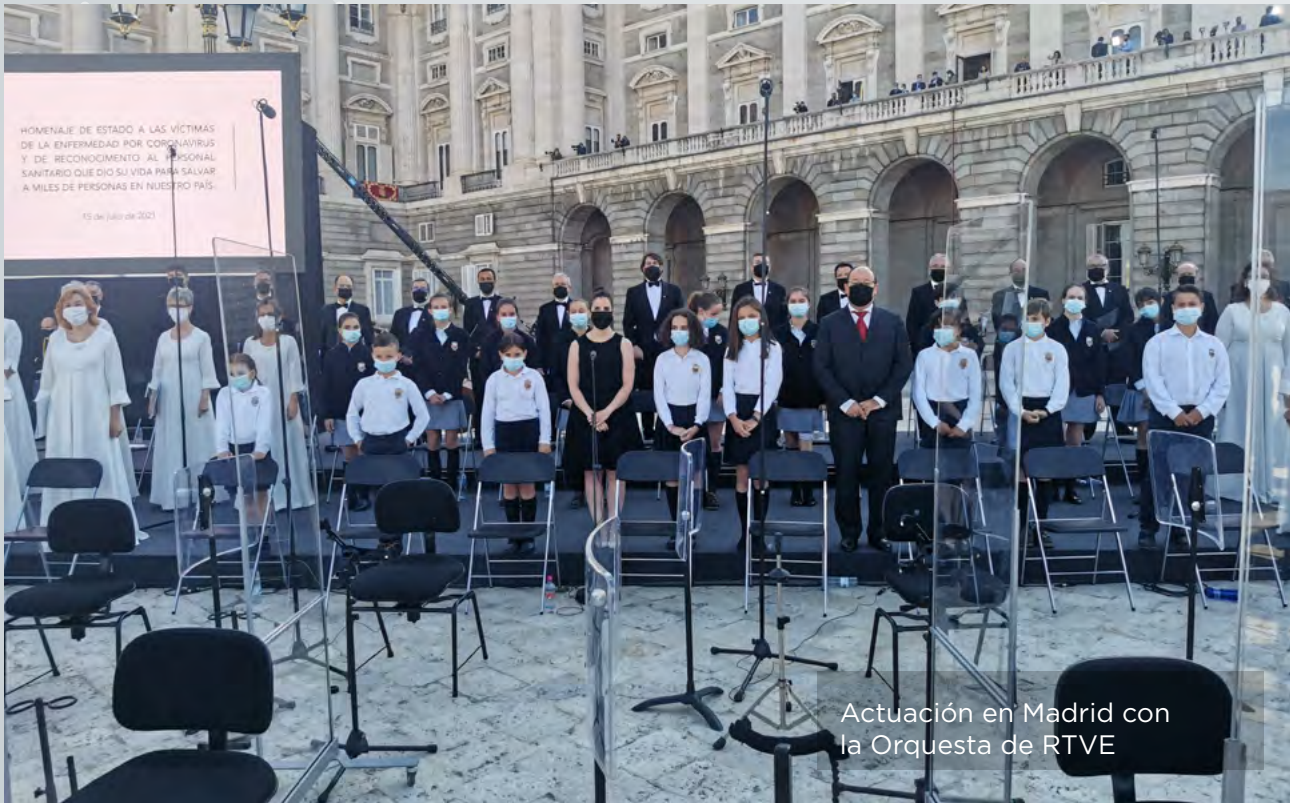
Actuación en Madrid con la Orquesta de RTVE