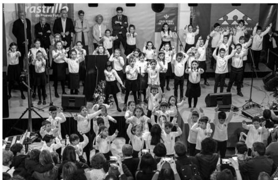
Actuación del Coro Infantil del Orfeón Pamplonés, durante la jornada inaugural del Rastrillo de 2019.