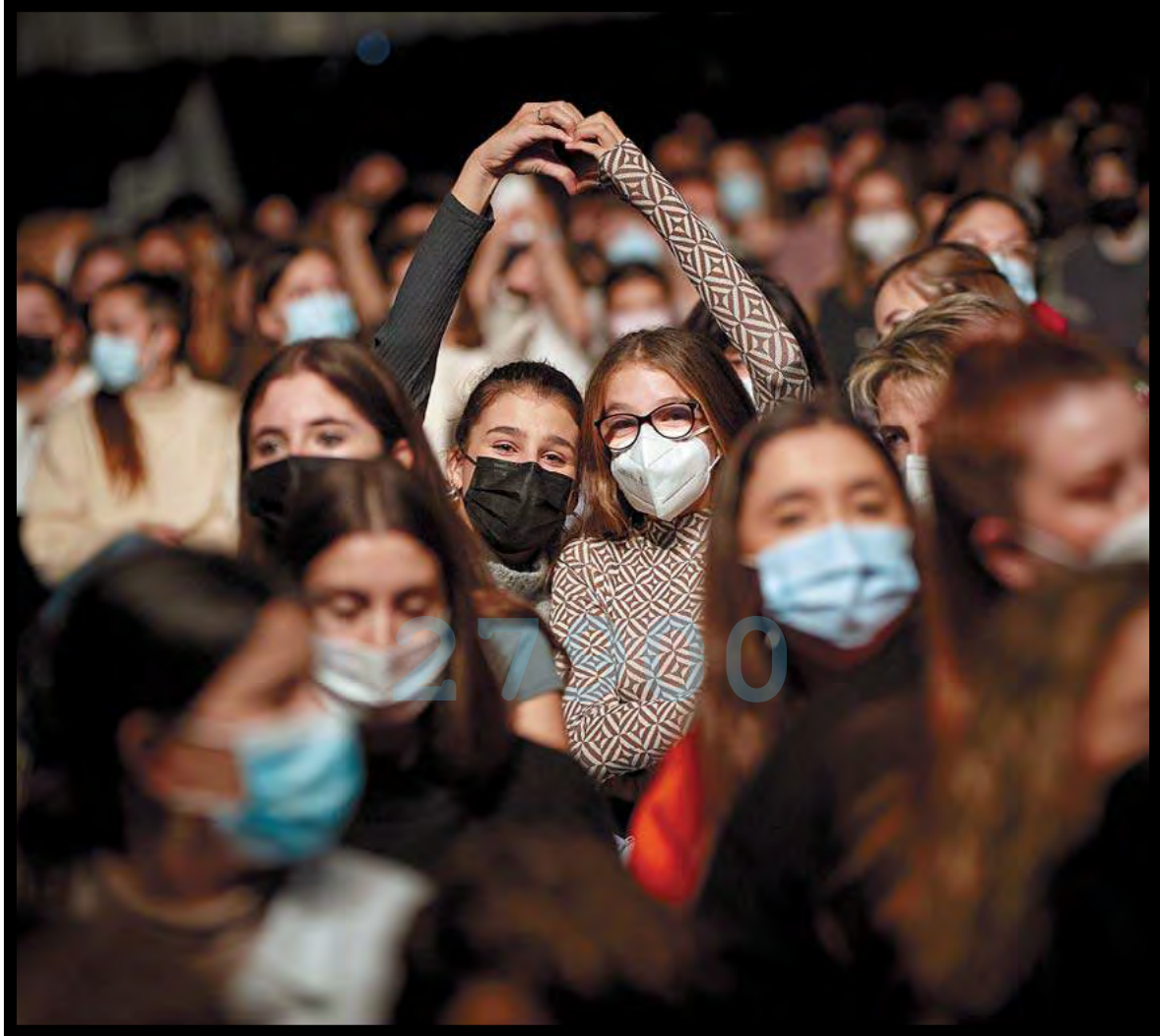
CONCIERTOS MÁS RECONOCIBLES La pandemia aún no permite disfrutar de los conciertos como antaño, pero al menos la presencia de público les ha permitido recuperar parte de su esencia. J.P. URRUTIA