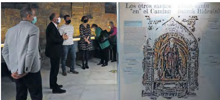
La zona central de la exposición la ocupan ocho paneles explicativos sobre distintos aspectos de temática jacobea.