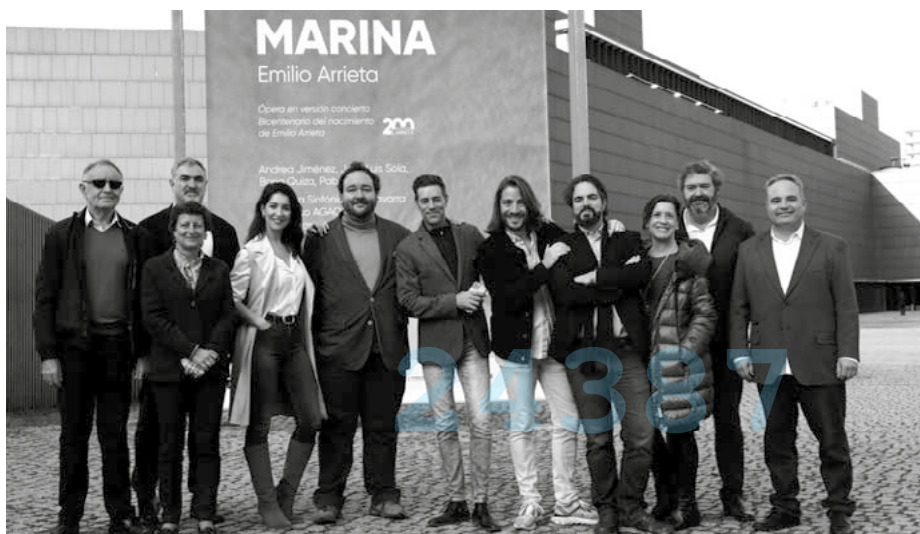
Representantes de la AGAO, intérpretes y representantes de Fundación Baluarte ayer en la presentación de la ópera Marina , que se interpretará en versión concierto hoy a las 20 horas en Baluarte.

■ Marina Sala Principal de Baluarte hoy a las 20 horas. Entradas desde 25 a 50 euros.