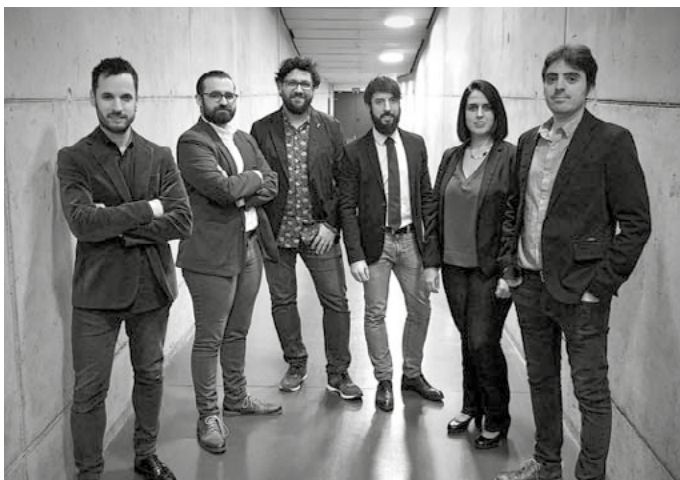
Formación para conciertos de cámara del grupo Forma Antiqua.