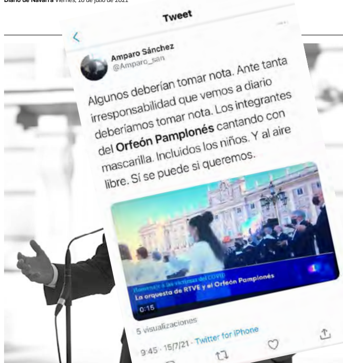
Casado compareció ayer ante los medios, y se refirió al estado de las víctimas de la pandemia.

tada y portavoz del PP en el Congreso, Cayetana Álvarez de Toledo. Casado no se sumó a la felicitación. "Todo vale para el convento", señalaron fuentes populares pa-