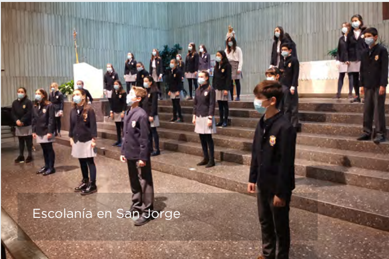
Escolanía en San Jorge