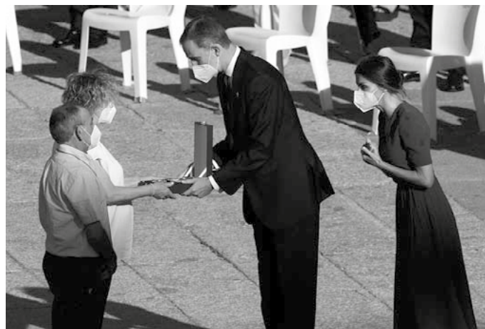
El Rey entrega la Cruz al Mérito Civil a los familiares de un sanitario.

A diferencia del estado de alarma, que el Gobierno puede decretar sin autorización previa del Congreso, el de excepción necesita recabar su permiso. En su solicitud, el Ejecutivo de turno debe especificar qué derechos fundamentales pretende suspender, en qué ámbito territorial y con qué duración, que no podrá exceder los 30 días. Eso sí, prorrogables por otro plazo igual.