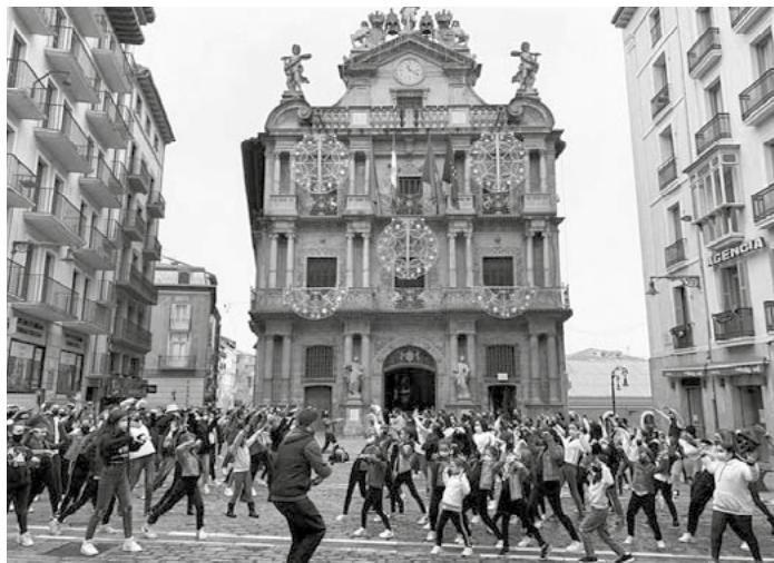
Alumnos de la Escuela de Baile Le Bal realizan una coreografía en la Plaza del Ayuntamiento.

La iniciativa ha contado con el apoyo de Protocolo del Ayuntamiento de Pamplona, la Policía Municipal y el Departamento de Turismo.