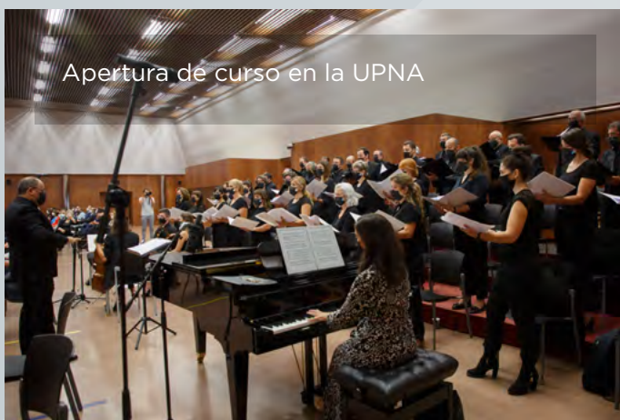
Apertura de curso en la UPNA