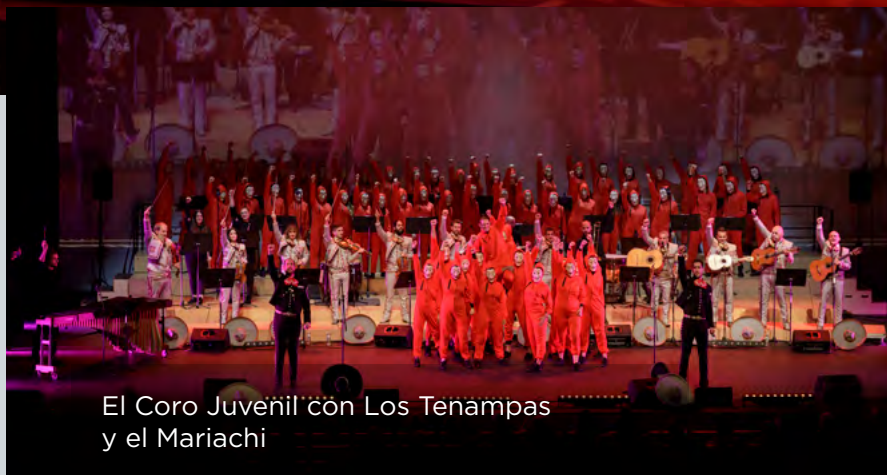
El Coro Juvenil con Los Tenampas y el Mariachi