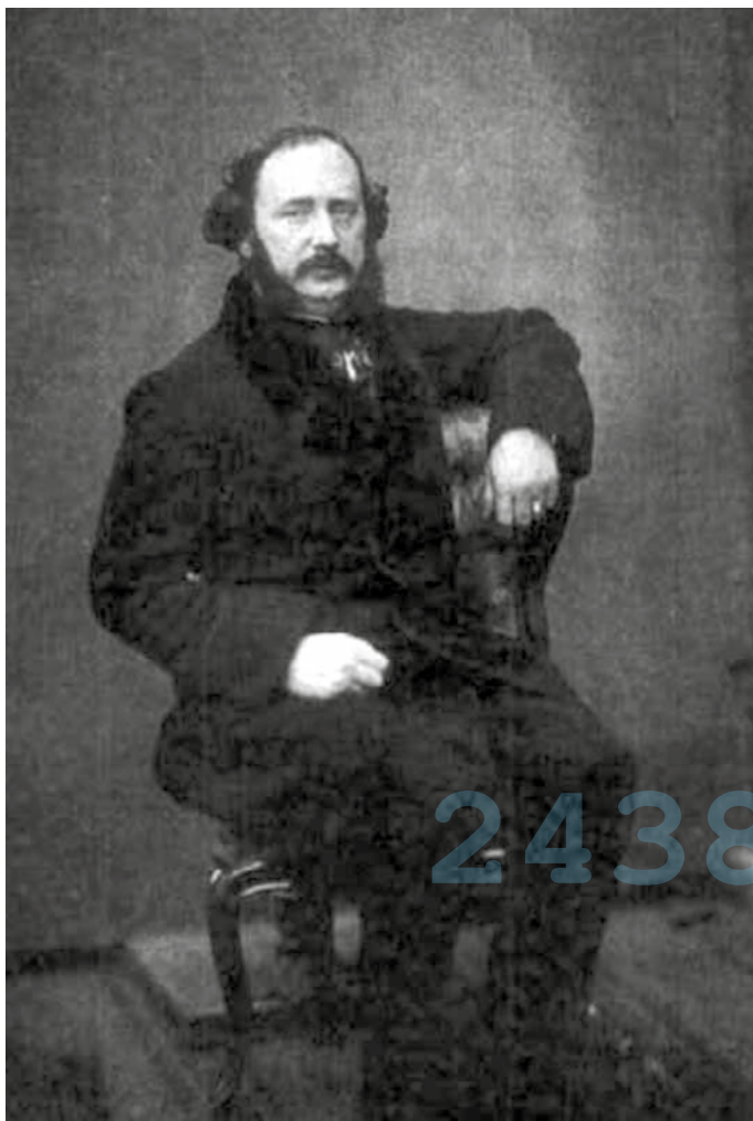
Retrato de Emilio Arrieta realizado hacia 1860, cuando el compositor rondaba los 40 años de edad.

Este miércoles se cumplen 200 años del nacimiento del compositor puentésino, a quien se le rendirá homenaje esta semana. Varias figuras del mundo de la música destacan su brillantez y proponen rescatar otros títulos ensombrecidos por la enorme popularidad de la ópera 'Marina'.