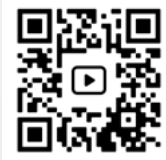
Coro Infantil en San Agustín