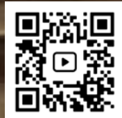
Concierto en Elizondo