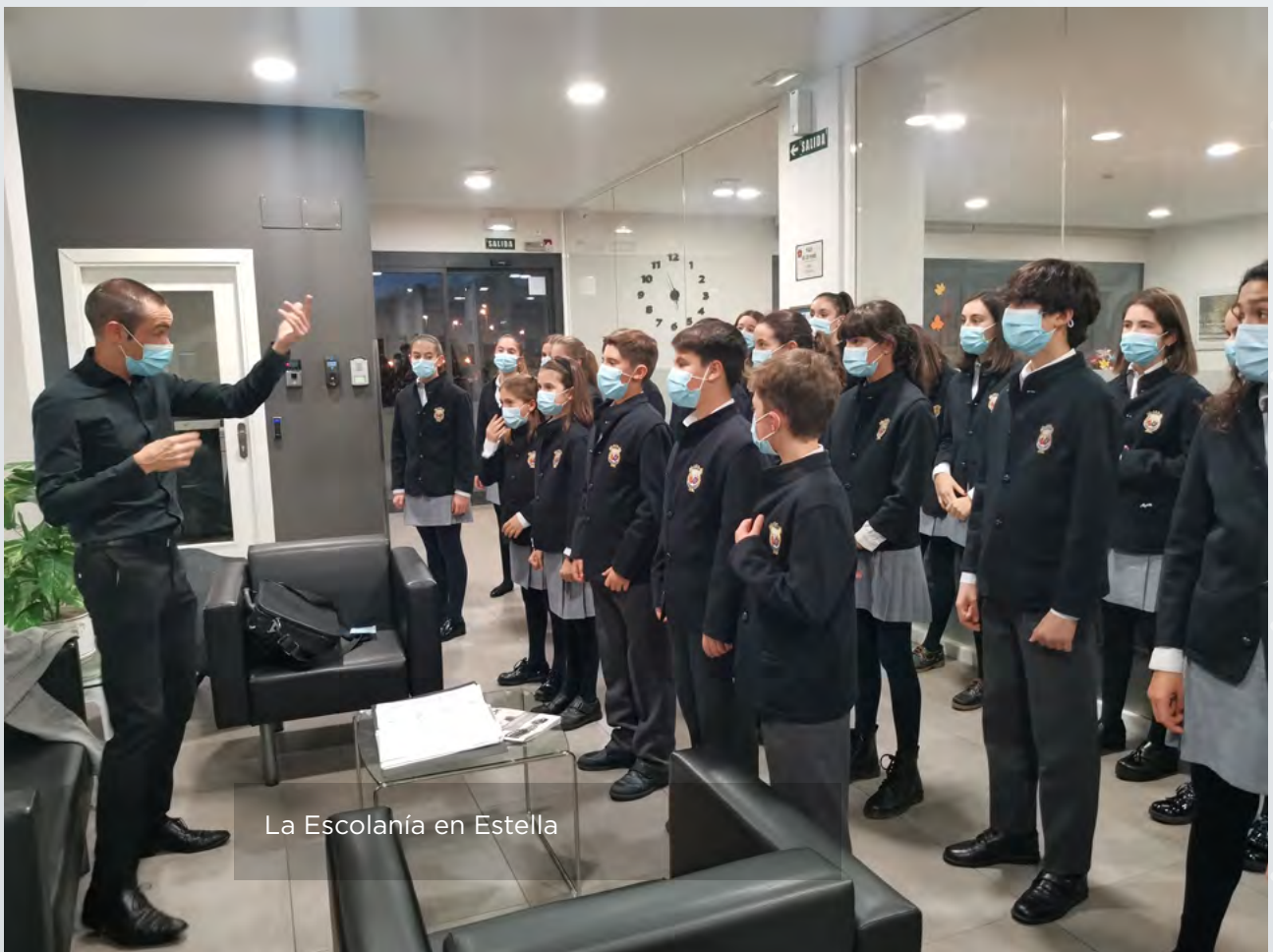
La Escolanía en Estella