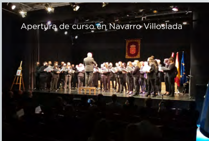
Apertura de curso en Navarra Villoslada