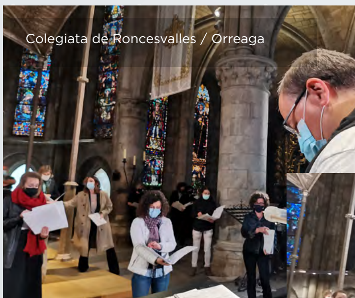
Colegiata de Roncesvalles / Orreaga

Volvió la música a distintos lugares de la Comunidad Foral: Elizondo, La Colegiata de Roncesvalles, Puente la Reina con música de Arrieta en el Segundo Centenario del nacimiento del compositor puentésino y Ujué, este último dentro de los cursos de verano de la UPNA, organizados por Jakiunde. En Pamplona, la Escuela Coral actuaba en distintos barrios y localidades de Pamplona, dentro del ciclo Barrios de Pamplona.