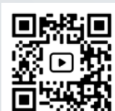
juvenil "love fills the moment" de David Azurza