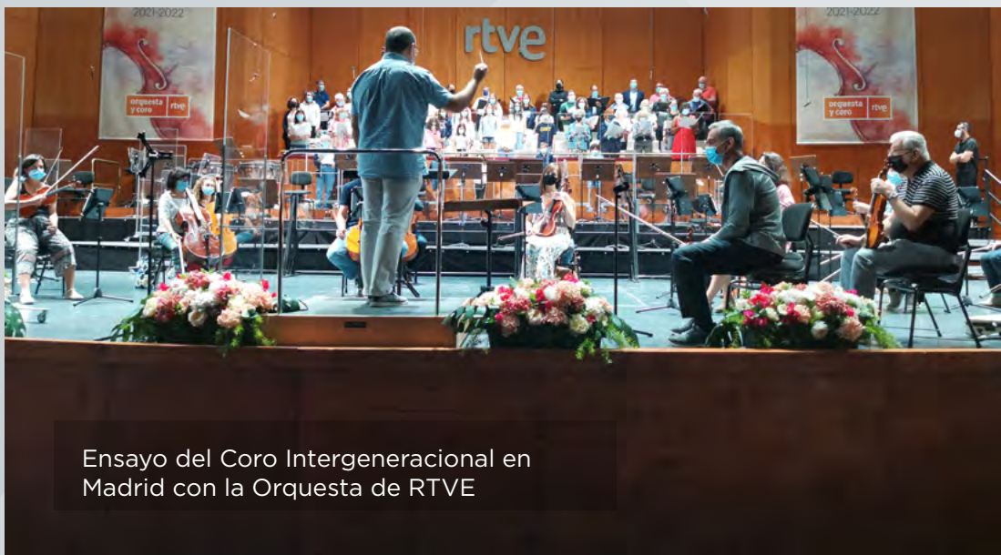
Ensayo del Coro Intergeneracional en Madrid con la Orquesta de RTVE