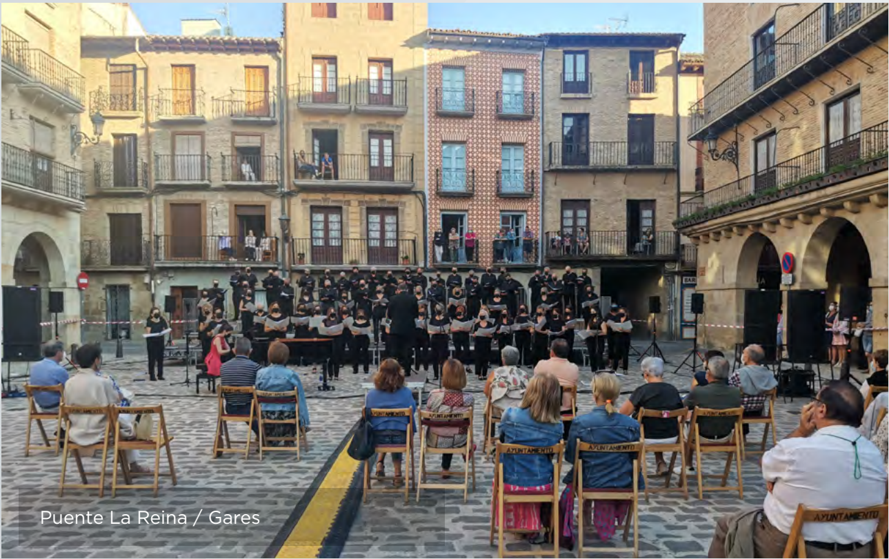
Puente La Reina / Gares