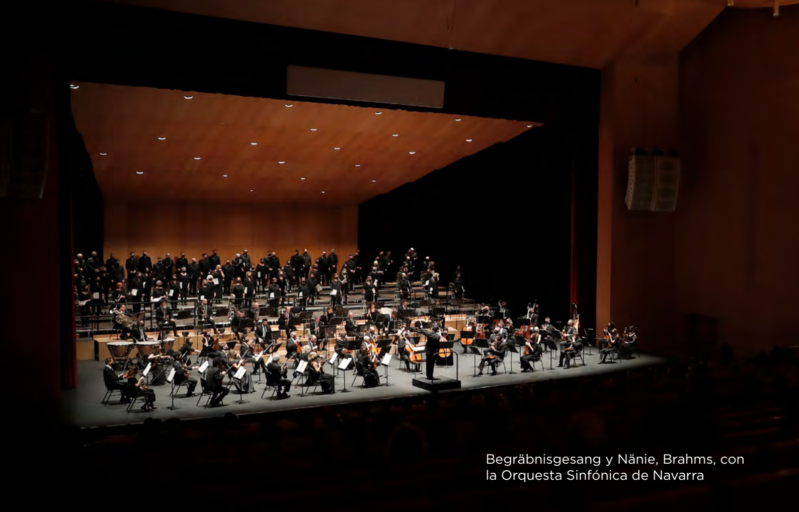
Begräbnisgesang y Nänie, Brahms, con la Orquesta Sinfónica de Navarra