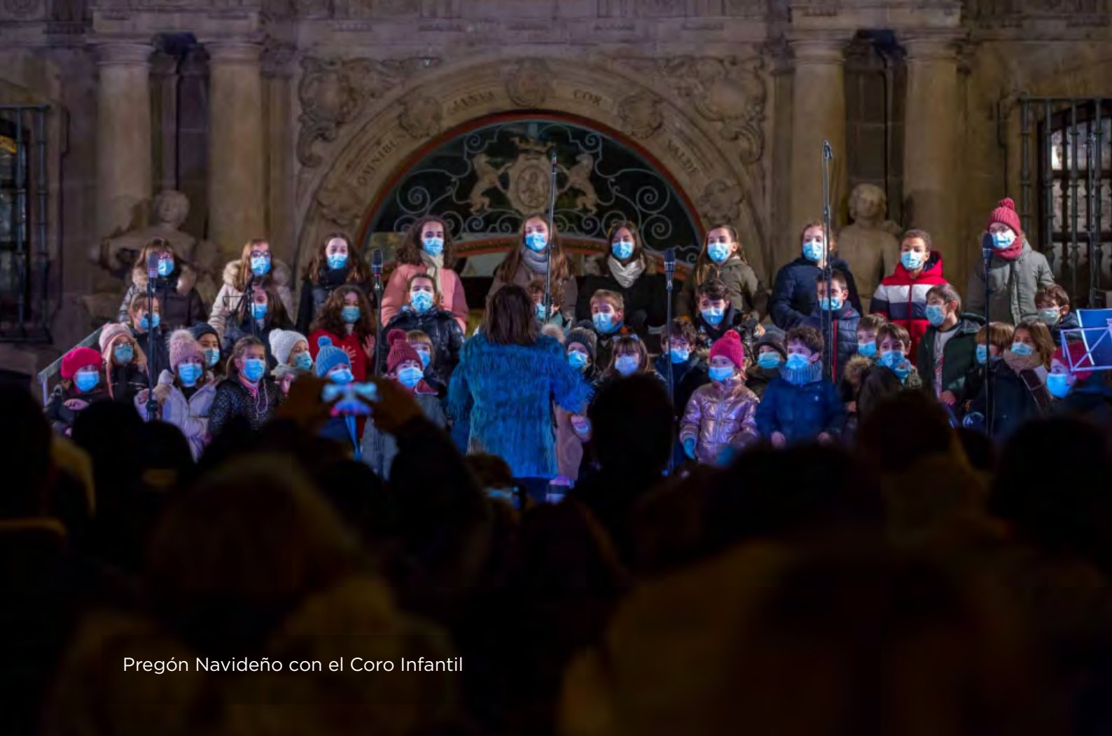
Pregón Navideño con el Coro Infantil