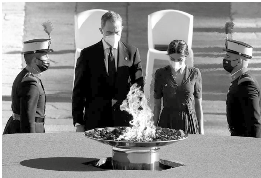
Felipe VI y la reina Letizia frente al pebetero encendido, ayer, en el homenaje de Estado a las víctimas del coronavirus en el Palacio Real.

Felipe VI preside por 2º año el homenaje a las víctimas de la covid, esta vez con la ausencia de Urkullu, Aragonès y Vox