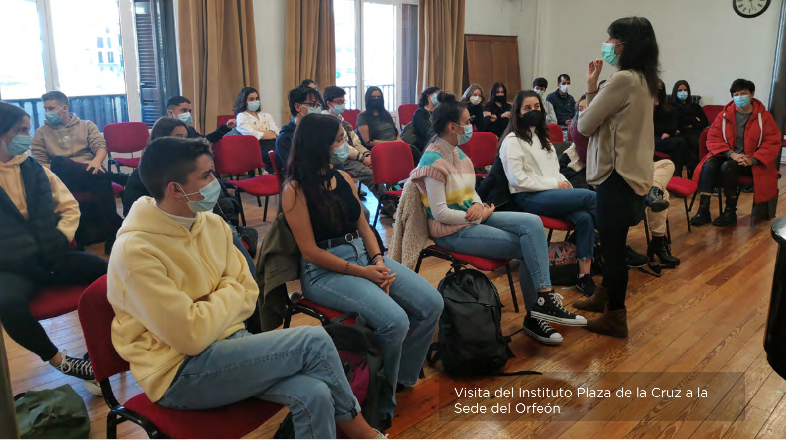
Visita del Instituto Plaza de la Cruz a la Sede del Orfeón