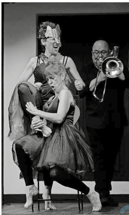
Las compañías Pasadas las 4 y Spanish Brass representan El burlador sin sardina ayer en Almagro.