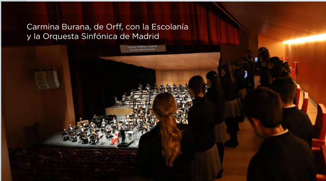
Carmina Burana, de Orff, con la Escolanía y la Orquesta Sinfónica de Madrid